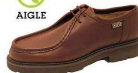
Chauss BOURGOGNE Du 39 au 46