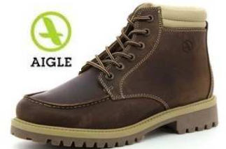
Chaussures BROWDY Du 39 au 46