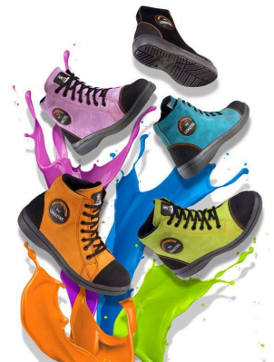
Chaussures VITAMINE Du 35 au 42