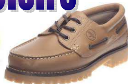
Chaussures TARMAC Du 37 au 46