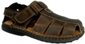
Chaussures TITAN Du 39 au 46