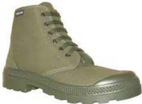
Chaussures BROUSSE Du 36 au 46