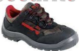
Chaussures MONACO Du 39 au 47