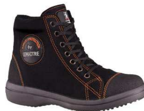
Chaussures VITAMEN Du 38 au 48