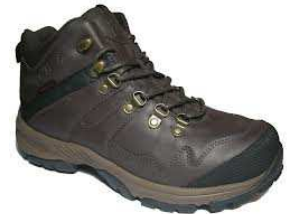
Chaussures DAKO Du 39 au 46