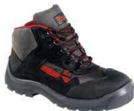
Chaussures MELBOURNE Du 39 au 47